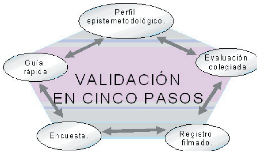
Gráfico 3: validación o contrastación de data de los cinco instrumentos.