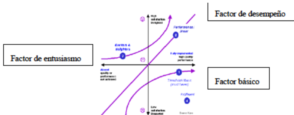
Figura 2. Modelo de Kano [2]

El modelo de N. Kano (Kano ed. al., 1984) es una técnica que se utiliza habitualmente para clasificar y evaluar la satisfacción de una población con relación al producto o servicio recibido. Este modelo distingue tres categorías de factores que tienen influencia sobre la satisfacción del cliente: Factores básicos, que son los requisitos mínimos que causarán el descontento del cliente si no se satisfacen, pero que no causan la satisfacción de cliente si se satisfacen; Factores de entusiasmo, que son los factores que aumentan la satisfacción de cliente si son entregados pero no causan el descontento si no se entregan y, finalmente Factores de desempeño, que causan la satisfacción, si el desempeño es alto, y causan el descontento si el desempeño es bajo. (Figura 2) Aunque el modelo de Kano ha sido utilizado normalmente desde su publicación por empresas industriales y comerciales para estudiar los elementos de satisfacción del cliente que adquiere un determinado producto o recibe un servicio, en los últimos años numerosos autores han estudiado su aplicabilidad en otros ámbitos, como el de la edificación (Llinares y Page, 2011), o incluso el de la satisfacción de los propios empleados de la empresa (Matzler ed. al., 2004). En este trabajo, se utiliza el modelo de Kano para el estudio de los elementos que causan satisfacción o insatisfacción a las personas que forman los varios grupos de interés de un centro de una Universidad Politécnica.