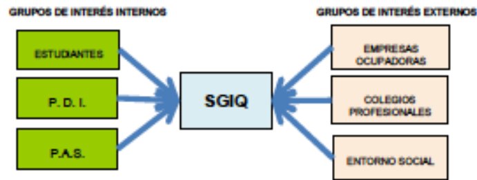
Figura 1. Grupos de interés [1]